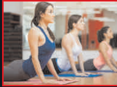
YOGA AND MEDITATION