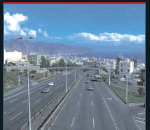
6 लेन एयरपोर्ट रोड (मात्र पीथम्पुर टोलगाव भीमच मार्ग) (मात्र 2 मिनट की दूरी)