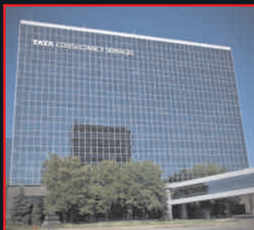
TCS (मात्र 6 मिनट)