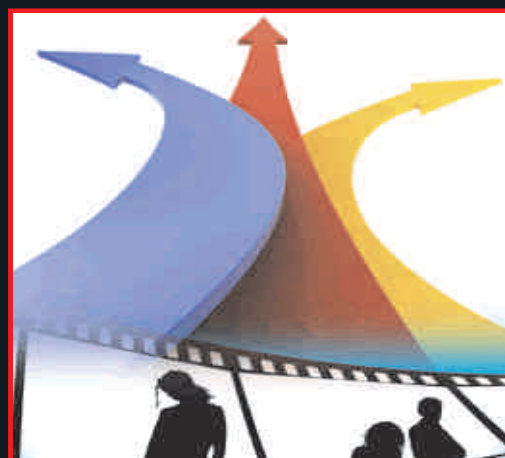
Infosys (मात्र 6 मिनट)