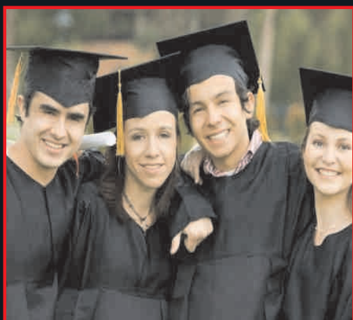
अरविन्दो, नरसीमुंजी, सिम्बायसिस, ओरियेंट, इन्वैर इन्द्रा, एलएन सिटी, श्रीराम, मॉडन, वेष्णो पोलोटेक्निक, एम.आई.एस.टी. जैसे लगभग 23 कॉलेज एवं युनिवर्सिटीयों का हब (मात्र 3 मिनट की दूरी)