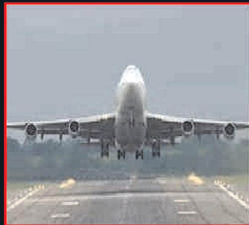
एयरपोर्ट (मात्र 10 मिनट की दूरी पर)