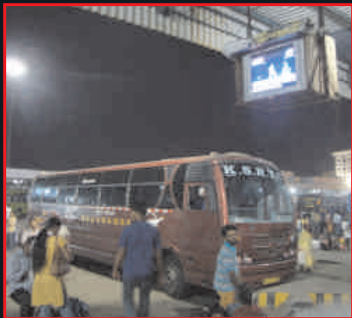
प्रस्तापित बस टर्मिनल (मात्र 5 मिनट की दूरी पर)

जो आप देख रहे हैं उससे अधिक सरकार द्वारा सुपर कॉरिडोर पर क्रियान्वयन किया गया एवं किया जा रहा है।