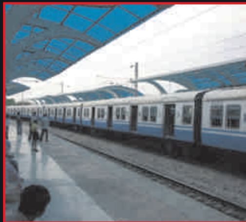
प्रस्तापित रेलवे स्टेशन (मात्र 5 मिनट की दूरी पर)