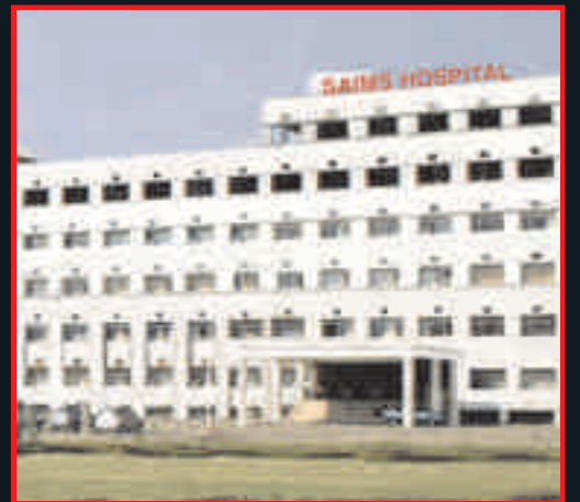
प्रदेश का विशालतम अरविन्दो हॉस्पिटल (मात्र 3 मिनट दूरी)